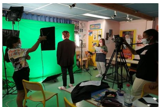
Tournage sur fond vert et effets spéciaux

RETROUVEZ TOUTE NOTRE ACTUALITE (PROJETS/EXERCICES/FILMS/RENCONTRES) sur le site du lycée, dans l'onglet "Actualités de l'enseignement audiovisuel": https://lyc-dumas-ales.ac-montpellier.fr/actualite-de-l-option-audiovisuelle