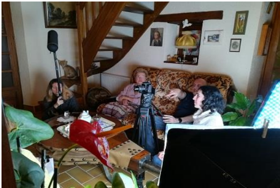
Elaboration d'une mise en scène

Cet enseignement est fondé sur un partenariat avec l'association culturelle le Festival de Cinéma d'Alès, Itinérances . La pratique est donc encadrée par des professionnels de l'image et du son grâce au soutien financier de la D.R.A.C. Occitanie.