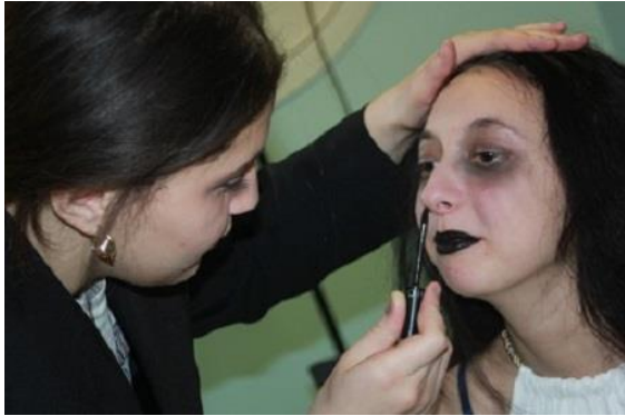
Costume et maquillage